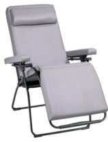
Fialová Empreinte LFM9018-9628