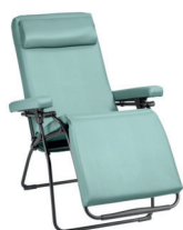
Zelená Eucalyptus LFM9018-9627